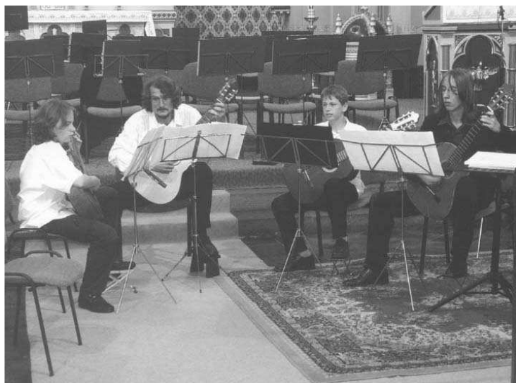
A Kodály Zoltán Zeneiskola által idén is megrendezett nemzetközi komolyzenei fesztivál koncertjei a katolikus templomban zajlottak