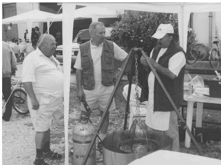
A főzőverseny ezúttal is komoly odafigyelést igényelt a legjobbtól is, akik tapasztalatcserére is felhasználhatták a Kistérségi Szentmiklós Napokat