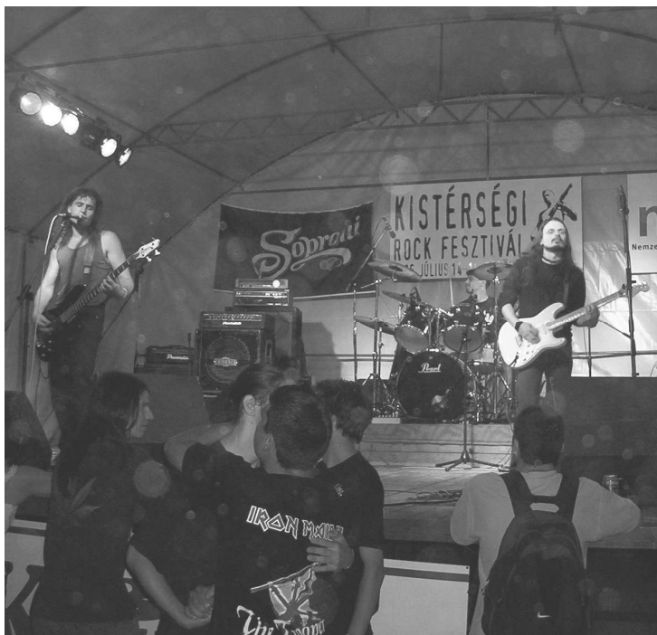
A fesztivál legjobbja a fegyverneki Zuhatag www.zuhatag.hu