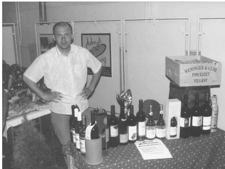
Ezúttal is lehetőséget kaptak a bemutatkozásra a város, a kistérség vállalkozásai, termelői, kereskedői.