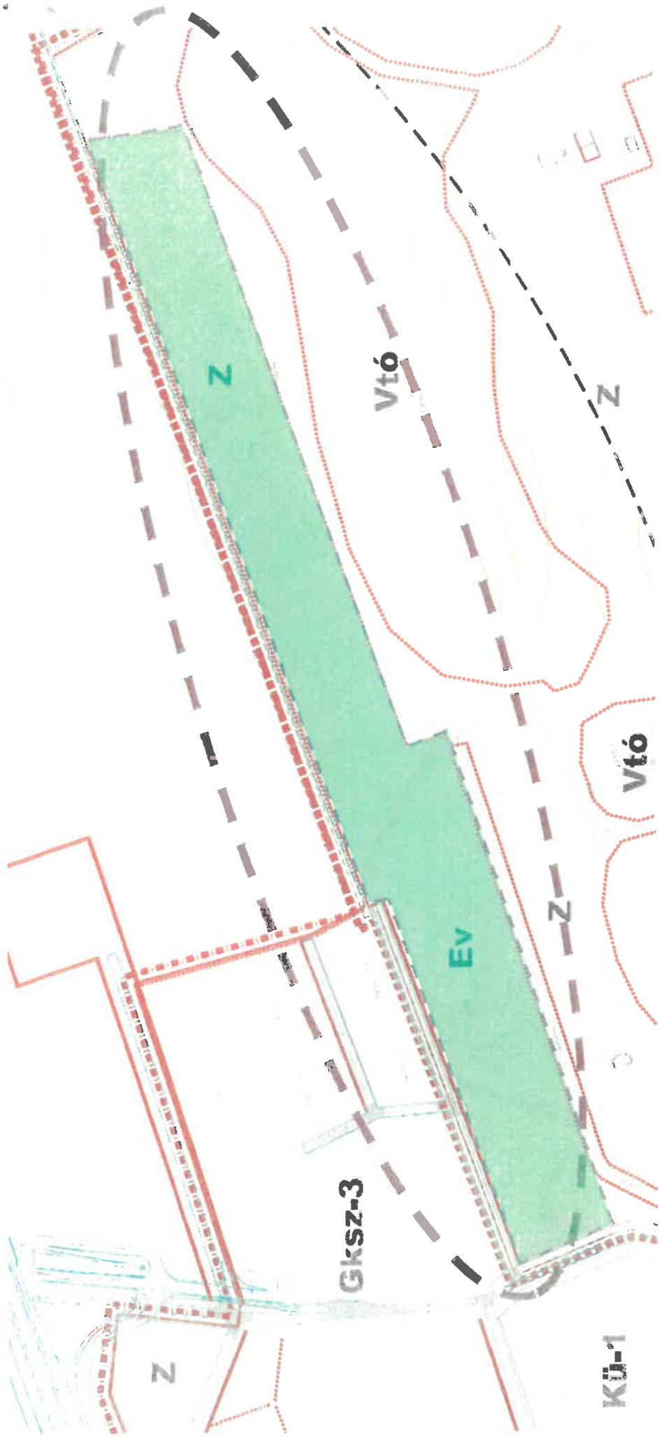
(1129. hrsz.) 21/2005. (VI. 24.) alaprendelet