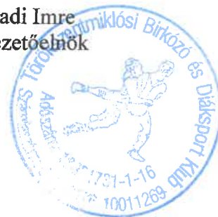
Sarkadi Imre ügyvezetőelnök