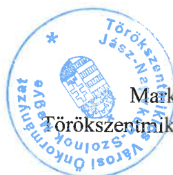
Markót Imre Polgármester Törökszentmiklós Városi Önkormányzat