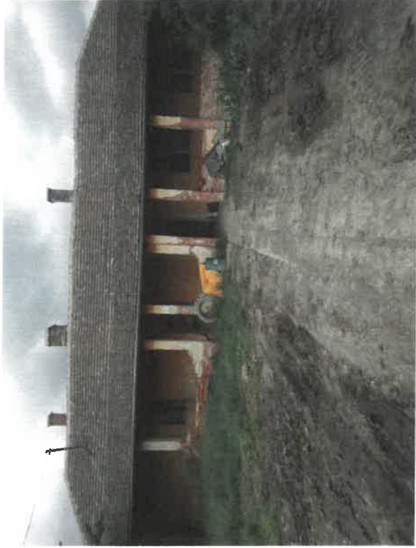
Szakállas telep 32., hrsz: 8022